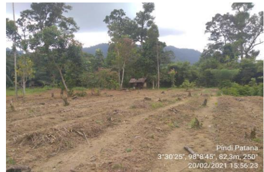
Gambar 4. Lokasi Tanam Kegiatan Restorasi