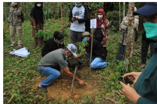
Gambar 5. Kegiatan Penanaman Tanaman MPTS

Terdapat 6 jenis pohon yang dipilih di dalam kegiatan restorasi ini. Pohon Durian, manggis, kelengkeng, alpukat, rambutan dan mangga merupakan pohon penghasil buah yang memiliki nilai ekonomi dan ekologi yang tinggi, selain itu pohon - pohon tersebut memiliki pertumbuhan yang cepat. Dengan kualitas bibit yang baik dalam waktu kurang dari 3-4 tahun pohon - pohon tersebut akan berbuah dan bisa dipanen oleh masyarakat. Penanaman bibit pohon dilakukan sebanyak 3 kali.