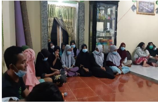
Gambar 2. Kegiatan FGD bersama masyarakat Desa Timbang Lawan