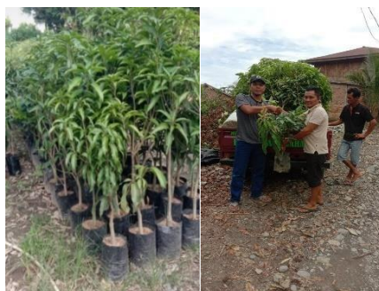
Gambar 3. Penyiapan Bibit Tanaman MPTS Untuk Kegiatan Restorasi

Penanaman dilakukan setelah bibit diberikan perlakuan adaptasi awal sebelum penanaman, hal ini dilakukan untuk meningkatkan daya tumbuh bibit yang akan ditanam dikarenakan sudah terlebih dahulu beradaptasi terhadap lokasi penanaman. Bibit dimasukkan kedalam lubang tanam yang telah ditambahkan kompos atau pupuk kandang. Polybag bibit dilepaskan dengan hati - hati agar tanah tidak buyar untuk mengurangi stress pada tanaman. Kemudian bibit ditanam kemudian ditimbun dengan tanah bekas galian lubang. Polybag ditancapkan pada ujung ajir, sebagai penanda bahwa bibit telah ditanam dengan melepaskan polybag.