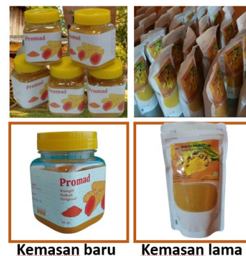
Kemasan baru Kemasan lama

Adapun realisasi dari pemenuhan Kansei Word dan konsep desain kedalam bentuk desain, dan perbandingannya dengan desain lama, ditunjukkan dalam Gambar 4 berikut :