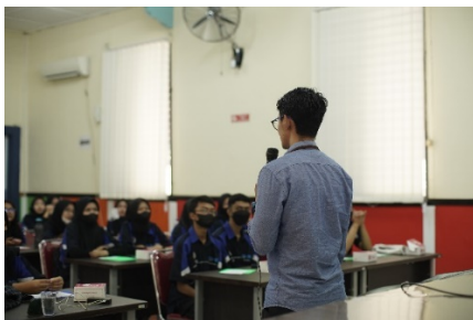
Gambar 2. Pemaparan Materi Komunikasi Lingkungan

Pelatihan ini diikuti 36 siswa-siswi dari SMKN 2 Bandung berusia 15 – 17 tahun yang diadakan di Aula SMKN 2 Bandung. Materi pertama berupa pemaparan teori dan konsep mengenai Komunikasi Lingkungan dan Media Baru yang dilaksanakan selama dua jam seperti pada Gambar 2.