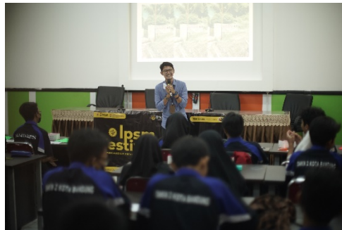
Gambar 1. Simulasi Interaktif untuk Advokasi Lingkungan di Media Sosial

Pelajar sekolah merupakan Generasi Z yang menjadi penerus bangsa dalam menjaga lingkungan sekitarnya masing-masing, termasuk siswa-siswi di SMK Negeri 2 Bandung. Tujuan Pengabdian Kepada Masyarakat (PKM) yang diadakan Universitas Telkom ini adalah mengenalkan pemanfaatan media sosial untuk advokasi lingkungan kepada siswa-siswi SMK Negeri 2 Bandung. Penerapan ilmu pengetahuan dan teknologi dalam pelatihan ini meliputi dua langkah, yaitu memberikan pemaparan materi berupa teori yang kemudian dilanjutkan melalui simulasi interaktif menggunakan media sosial. Pelatihan ini dilaksanakan selama satu hari pada Rabu, 7 September 2022 dan diikuti oleh 36 siswa-siswi SMKN 2 Bandung seperti yang tertera pada Gambar 1.