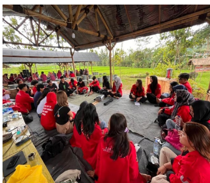
Gambar 1. Mahasiswa KM 44-MC-01 Ketika melakukan Brainstorming dan laporan progress kegiatan di Saung Desa Wisata Cisande Pada Kamis (02/06/22). (Dok. Festival Cisande KM-44-MC-01).

melakukan pendekatan serta melakukan dokumentasi footage hingga video untuk membuat beberapa konten khususnya Video Village Overview . Lalu, pada 2 Juni 2022 disusul dengan rombongan selanjutnya untuk ikut melakukan survey serta menjalankan beberapa kebutuhan yang perlu dilakukan di Desa Wisata Cisande. Pada hari yang sama, mahasiswa lainnya melakukan brainstorming terlebih dahulu serta menindaklanjuti laporan terhadap progress yang sudah lebih dulu rombongan sebelumnya dapatkan. Setelah itu, rombongan kedua ini terbagi menjadi beberapa kelompok untuk menjalankan tugasnya masing-masing, seperti ada yang membuat konten Tiktok, berkeliling untuk observasi potensi Desa Wisata Cisande, melakukan konfirmasi terhadap Kepala Pokdarwis hingga sekelompok Divisi Creative membuat konsep dan melakukan tapping untuk Video Village Overview .