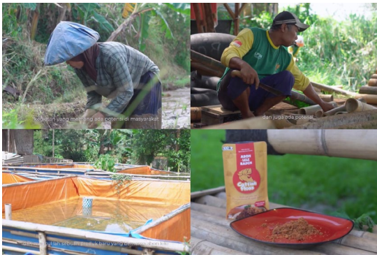
Gambar 2. Cuplikan isi dari Video Village Overview Desa Wisata Cisande

keindahan serta damai-nya masyarakat Desa Wisata Cisande dalam melestarikan potensi yang dimiliki oleh Desa Wisata Cisande. Dengan alunan aransemen yang disajikan didalam Video Village Overview tersebut semakin membuat pandangan maupun perasaan Rencang Cisande terasa lebih hangat ketika sedang menonton tayangan Video Village Overview Desa Wisata Cisande. Video Village Overview tersebut pertama kali dipublikasi di Instagram @festivalcisande Pada Minggu, 16 Oktober 2022 dan sudah diputar sebanyak 1.591 kali serta diplatform Youtube Festival Cisande Pada Jumat, 9 Desember 2022.