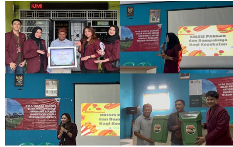
Gambar 3. Potret Kegiatan Mahasiswa Festival Cisande MC-01 dalam menjalankan Kegiatan yang bertajuk "Festival Cisande Food Wise " Pada Sabtu (05/11/22). (Dok. Festival Cisande KM-44-MC-01).

Seperti yang sudah disampaikan sebelumnya, bahwa di Desa Wisata Cisande terdapat UMKM budidaya ikan lele hingga produksi Abon Lele Raden yang dimana sesuai dengan kegiatan yang dilakukan oleh Festival Cisande yang bertajuk "Festival Cisande Food Wise ". Maka dari itu, pada Sabtu, 5 November 2022, perwakilan dari MC-01 mengadakan kunjungan desa kembali dengan tujuan untuk sosialisasi terkait upaya menghindari Food Waste. Rangkaian terakhir yang dilakukan ialah pemberian tempat sampah khusus bagi masyarakat Desa Cisande sebagai lambang komitmen untuk menjaga lingkungan dengan lebih bijak dalam hal Food Waste. Kegiatan tersebut dilakukan berdasarkan isi dari Video Village Overview Desa Wisata Cisande yang menjelaskan mengenai Kegiatan Pemberdayaan Masyarakat Desa Wisata Cisande dalam menjalankan budidaya Ikan Lele hingga UMKM Abon Lele Raden.