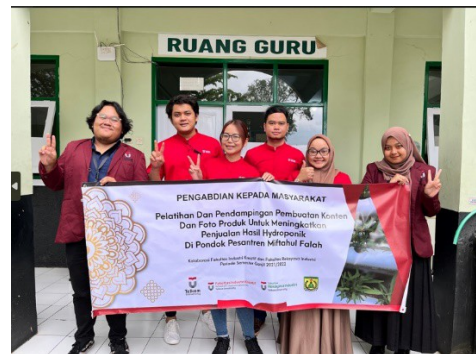
Gambar 7. Foto tim abdimas dari Universitas Telkom

Sebagai penutup kegiatan ini dilakukan survei terhadap peserta kegiatan sebagai penerima manfaat kegiatan abdimas. Dari survei yang dilakukan didapatkan kesimpulan seluruh peserta kegiatan mendapatkan manfaat dari kegiatan ini.