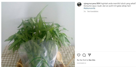
Gambar 1. Hasil foto produk di instagram produk hidroponik Pondok Pesantren Miftahul Falah.

Berikut adalah hasil tangkapan layar foto produk yang dibuat oleh pengurus instagram produk hidroponik dari Pondok Pesantren Miftahul Falah.