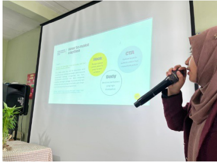
Gambar 3. Materi pelatihan tentang penulisan caption/ copywriting di instagram

Setelah transfer ilmu dilakukan, dilakukan sesi praktik yaitu pengaplikasian materi yang barusan diberikan. Tim abdimas memberikan beberapa bahan dan perlengkapan yang diperlukan dalam melakukan foto produk. Kemudian peserta diminta membuat kelompok berisi 2 orang. Tiap kelompok memilih satu anggota sebagai fotografer dan satu orang lain untuk membuat caption . Kamera yang digunakan adalah ponsel masing-masing peserta. Setelah konten dibuat, konten tersebut wajib diunggah ke instagram menggunakan hashtag #mifaxtelkom. Hasil konten yang telah diunggah akan diberikan komentar dan dipilih 3 konten terbaik dan diberikan hadiah.