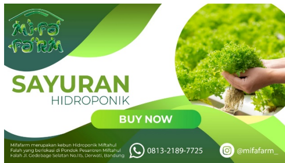
Gambar 8. Hasil Foto produk dan Copywriting

Kegiatan ini menjadi masukan positif dan diharapkan mampu meningkatkan penjualan produk