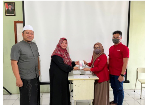
Gambar 6. Pembagian hadiah pembuatan konten terbaik

Sebagai penutup kegiatan ini dilakukan survei terhadap peserta kegiatan sebagai penerima manfaat kegiatan abdimas. Dari survei yang dilakukan didapatkan kesimpulan seluruh peserta kegiatan mendapatkan manfaat dari kegiatan ini.