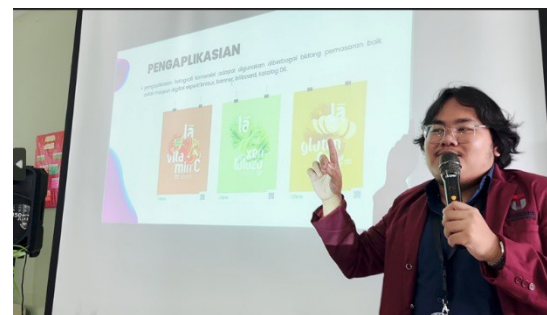
Gambar 2. Materi pelatihan tentang foto produk

Pelaksanaan pelatihan dilakukan selama 1 hari di tanggal 23 November 2022. Peserta kegiatan ini terdiri dari para guru dan santri Pesantren Miftahul Falah. Sekitar 20 orang peserta hadir dalam pelatihan ini. Sesi pertama dalam pelatihan ini adalah pemberian materi mengenai foto produk dan penulisan caption . Pada materi foto produk, peserta diajarkan untuk mengenal apa saja perlengkapan yang dibutuhkan dan bagaimana angle (sudut kamera) yang menarik dalam foto produk.