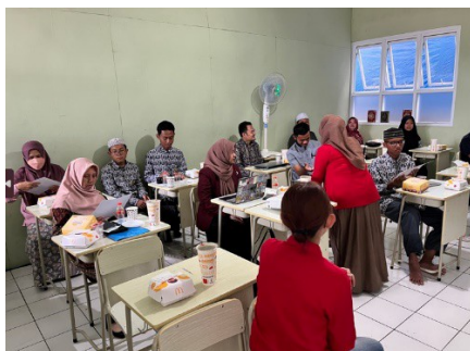
Gambar 4. Suasana lomba pembuatan konten menggunakan alat dan bahan yang disediakan