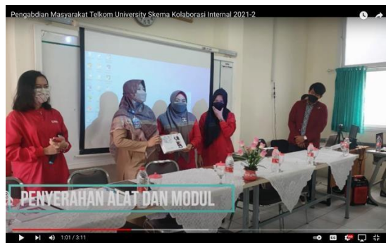
Gambar 2. Penyerahan alat dan modul OneNote.

https://www.youtube.com/watch?v=BxrBmVgBDE&t=48s seperti yang ditunjukkan pada Gambar 2.