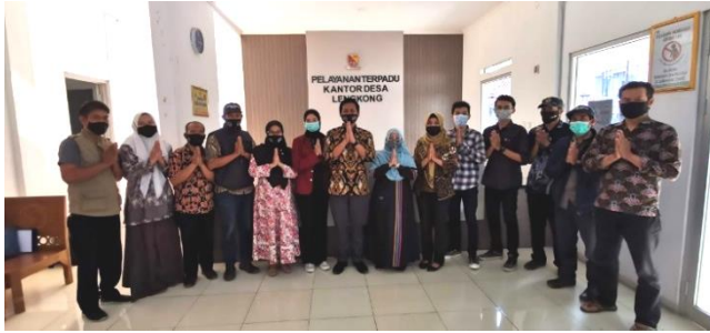
Penutupan Kegiatan Abdimas Kolaborasi Desa Lengkong