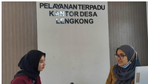
Gambar 2 Wawancara dengan Perangkat Desa

Tapi kendalanya adalah jika ada orang yang tidak membawa surat pengantar dari RT/RW dan syarat-syarat lainnya, sehingga harus kembali lagi ke kantor desa untuk melengkapinya.