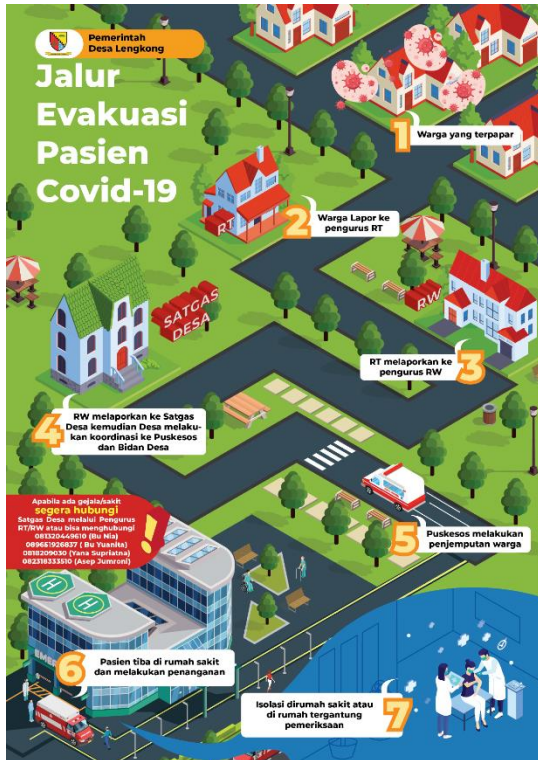
Gambar 6 Poster Terkait Pandemi COVID-19

Pelatihan pengelolaan media public awareness dilaksanakan pada tanggal 22- 23 Juni 2021, namun dikarenakan tim media terkendala karena kondisi kesehatan sehingga tidak dapat mengikuti kegiatan yang diselenggarakan melalui Zoom Meeting. Kegiatan dapat di simak kembali pada channel youtube.