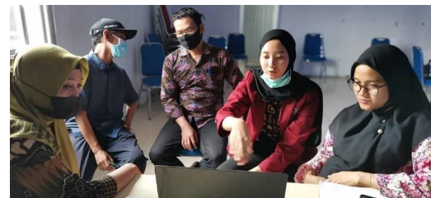
Pengujian Sistem Informasi oleh Perangkat Desa