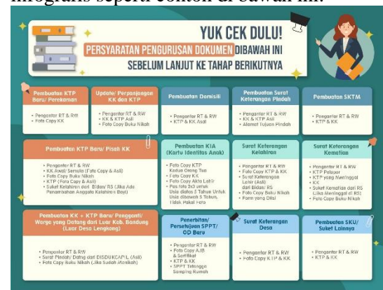
Gambar 5 Poster dipasang di Rumah Ketua RT

Dengan kondisi ini perlu dibuat sebuah aplikasi layanan administrasi surat kependudukan berbasis online agar staf pelayanan di Desa Lengkong dapat dengan mudah melayani administrasi pembuatan surat kependudukan. Selain itu masyarakat tidak perlu mendatangi kantor kelurahan, cukup mengajukan permohonan pembuatan surat dari rumah melalui aplikasi web. Sehingga tujuan utama desa Lengkong sebagai Smart Village bisa tercapai (Maja, Meyer, & Von Solms, 2020). Untuk meningkatkan public awareness masyarakat Desa Lengkong diperlukan berbagai media sosialisasi, salah satunya dalam bentuk infografis seperti contoh di bawah ini: