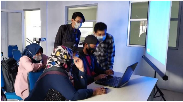
Pengujian Sistem Informasi oleh Ketua RW