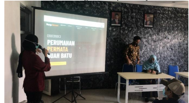
Presentasi Sistem Informasi