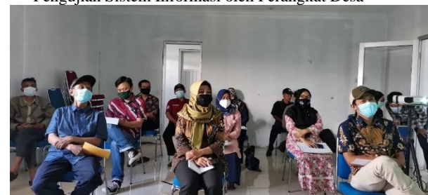
Peserta Berasal dari Perangkat Desa dan Perwakilan Ketua RW