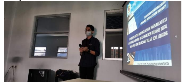
Pembukaan Kegiatan Pengabdian kepada Masyarakat