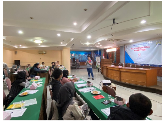
Gambar 2. Pelaksanaan Pengabdian Masyarakat

Dari team Universitas Telkom menyampaikan paparan Digital marketing berisi penjelasan apakah Digital marketing, kenapa harus Digital marketing, apakah keuntungan dan kerugian Digital marketing, mahalkah penggunaan Digital marketing?, apa saja yang harus di siapkan sebelum dan setelah melakukan digital marketing, dan tentang cloudERP, serta bagaimana Telkom University bisa membantu UKM implementasi Digital Marketing, dan demo SAP Analytic Cloud yaitu aplikasi yang bisa digunakan untuk mendorong dalam menganalisis penjualan untuk UKMAcara dilanjutkan dengan tanya jawab dan pengisian kuesioner, dan kemudian dilanjutkan dengan penutupan acara dan tak lupa diberikan semacam plakat kerjasama antara Telkom University dan Kadin Kota Bandung. Dilanjutkan dengan foto Bersama dengan tetap menjaga protocol kesehatan dan maka berakhirilah acara pengabdian masyarakat dengan tema "Pelatihan proses bisnis berbasis ERP untuk optimalisasi perusahaan lebih efisien dan efektif anggota Kadin Kota Bandung sesi digital Marketing". Kegiatan selanjutnya adalah menjalin kerjasama jangka panjang dengan peserta pelatihan melalui pembinaan implementasi Digital marketing, dan berikutnya adalah pelatihan pemanfaatan digital marketing untuk menembus pasar yang sudah berbasis digital.