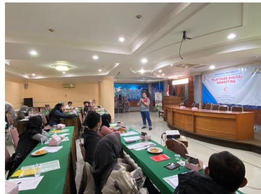
Gambar 2. Pelaksanaan Pengabdian Masyarakat

Dari team Universitas Telkom menyampaikan paparan Digital marketing berisi penjelasan apakah Digital marketing, kenapa harus Digital marketing, apakah keuntungan dan kerugian Digital marketing, mahalkah penggunaan Digital marketing?, apa saja yang harus di siapkan sebelum dan setelah melakukan digital marketing, dan tentang cloudERP, serta bagaimana Telkom University bisa membantu UKM implementasi Digital Marketing, dan demo SAP Analytic Cloud yaitu aplikasi yang bisa digunakan untuk mendorong dalam menganalisis penjualan untuk UKMAcara dilanjutkan dengan tanya jawab dan pengisian kuesioner, dan kemudian dilanjutkan dengan penutupan acara dan tak lupa diberikan semacam plakat kerjasama antara Telkom University dan Kadin Kota Bandung. Dilanjutkan dengan foto Bersama dengan tetap menjaga protocol kesehatan dan maka berakhirlah acara pengabdian masyarakat dengan tema “Pelatihan proses bisnis berbasis ERP untuk optimalisasi perusahaan lebih efisien dan efektif anggota Kadin Kota Bandung sesi digital Marketing”. Kegiatan selanjutnya adalah menjalin kerjasama jangka panjang dengan peserta pelatihan melalui pembinaan implementasi Digital marketing, dan berikutnya adalah pelatihan pemanfaatan digital marketing untuk menembus pasar yang sudah berbasis digital.