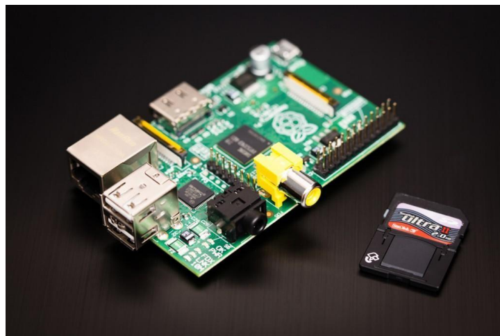
Gambar 2.1 Raspberry Pi

Raspberry Pi diluncurkan pertama kali pada 29 Februari 2012. Raspberry Pi memiliki dua model, model A dan model B. Harga Resmi untuk model A adalah US$ 25 atau sekitar Rp 250.000 dan model B adalah US$ 35 atau sekitar Rp 350.000 (belum termasuk biaya impor dan pajak ke Indonesia). Perbedaan model A dan B terletak pada memory yang digunakan. Model A menggunakan memory 256 MB dan model B 512 MB. Selain itu model B juga sudah dilengkapi dengan ethernet port (kartu jaringan) yang tidak terdapat di model A. Ada beberapa sistem operasi luar biasa yang bisa digunakan di Raspberry pi, yaitu Linux Debian, Arch Linux ARM, Raspbmc, OpenELEC, dan Android.