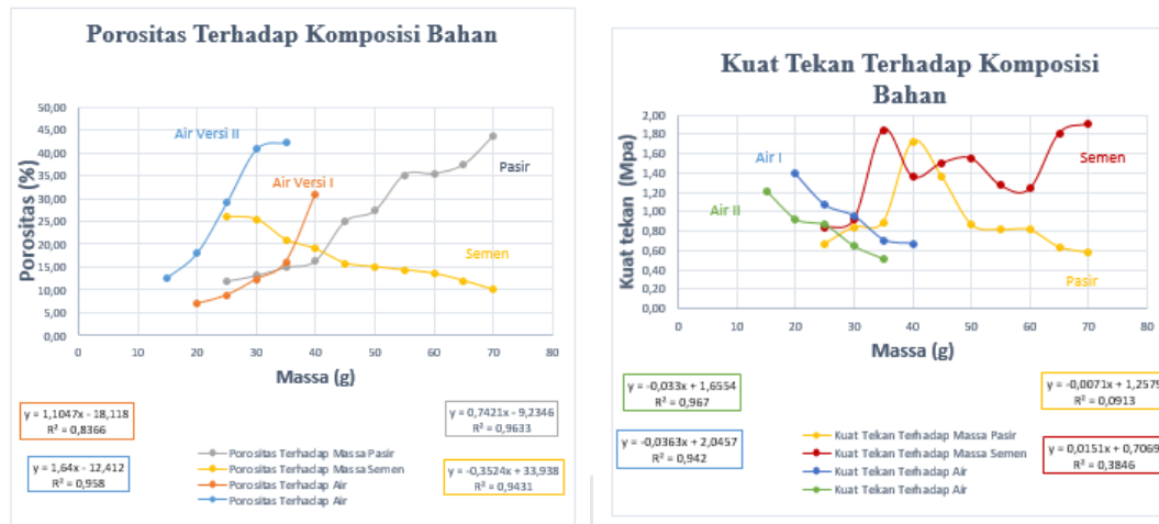
Gambar 3. Grafik Nilai Porositas dan Kuat Tekan

Pada saat penambahan pasir pada masing-masing sampel, nilai persen porositas sampel akan naik, hal ini akan memperkecil konstanta dielektrik sehingga nilai kapasitansi akan turun. Nilai resistivitas akan naik seiring nilai porositas yang naik namun karena terdapat banyak rongga atau pori nilai kuat tekan bahan akan cenderung turun. Hal ini membuktikan bahwa penambahan jumlah pasir akan menambah jumlah pori-pori bahan sehingga porositas bahan akan bertambah dan akan berbanding terbalik dengan nilai kapasitansi yang akan menurun [7].