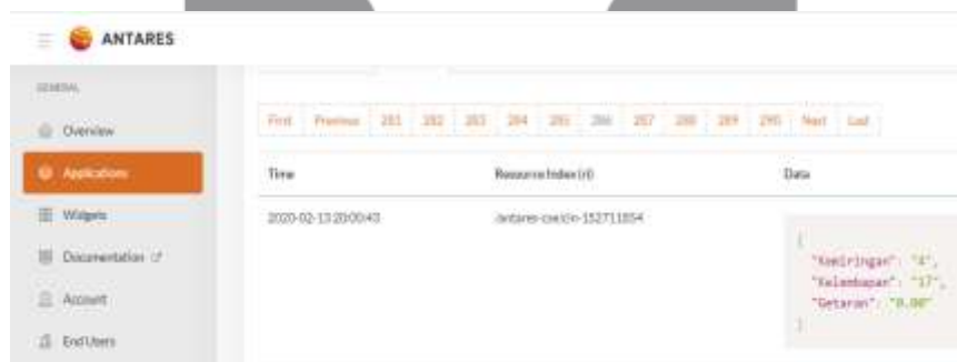
Gambar 3 data sampai di antares

Pada Gambar 3 data sensor telah sampai ke platform Antares berupa data kemiringan sudut x dan sudut y dengan satuan derajat ( ^{\circ} ), kadar air dengan satuan persen (%) dan getaran dengan satuan akselerasi (g).