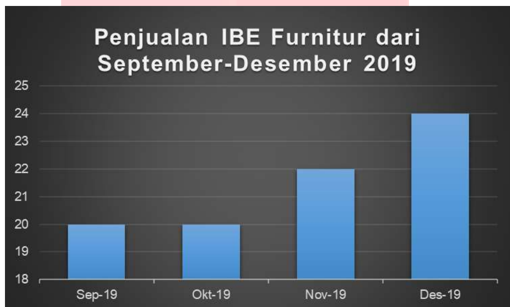
Gambar I Penjualan IBE Furnitur

Dapat dilihat setiap bulannya jumlah pesanan untuk produk IBE Furnitur selalu mengalami peningkatan, pada bulan Agustus total produk yang terjual sebanyak 20 unit, pada bulan September 20 unit, pada bulan Oktober 22 unit dan pada November sebanyak 24 unit. Jenis produk nya antara lain meja-X, rak custom, beanbag, meja custom.