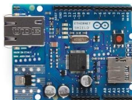
Gambar 2(d) Shield Ethernet

Ethernet Shield memiliki sebuah standar koneksi RJ-45, dengan sebuah baris transformator terintegrasi dan power atas Ethernet diaktifkan. Terdapat sebuah slot kartu microSD pada board, yang dapat digunakan untuk menyimpan data untuk pelayanan jaringan. Shield ini juga memuat sebuah reset controller, untuk memastikan bahwa modul Ethernet W5100 tereset dengan baik ketika power-up.