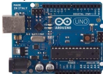
Gambar 2(a) Papan Arduino Board

Uno berarti "satu" dalam bahasa Itali dan dinamakan untuk menandakan peluncuran mendatang dari Arduino 1.0. Uno dan Versi 1.0, menjadi referensi versi-versi dari Arduino ke depannya. Uno merupakan seri terakhir dari board USB Arduino dan referensi model untuk platform Arduino.