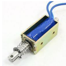
Gambar 2(c) Solenoid push and pull

Solenoid ini baik dan kuat secara khusus, dengan panjang 40mm dan sebuah armature yang ditahan dengan sebuah pegas kembali. Hal ini berarti ketika solenoid diaktifkan dengan tegangan mencapai 24VDC, solenoid bergerak dan kemudian ketika tegangan dihilangkan, solenoid akan meloncat kembali ke posisi semula, yang cukup berguna.