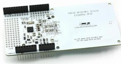
Gambar 2(b) Shield NFC PN532

NFC Shield merupakan alat sempurna untuk aplikasi NFC atau RFID 13.56MHz apapun. NFC Shield menggunakan chipset PN532 (chip NFC yang paling populer di pasaran) dan juga tertanam cukup banyak di dalam setiap telepon atau perangkat yang melakukan NFC. Chipset ini sangat kuat dan cukup banyak dapat melakukan semuanya, seperti membaca dan menulis ke tag dan kartu, berkomunikasi dengan telepon (untuk proses pembayaran), dan bertindak seperti sebuah tag NFC.