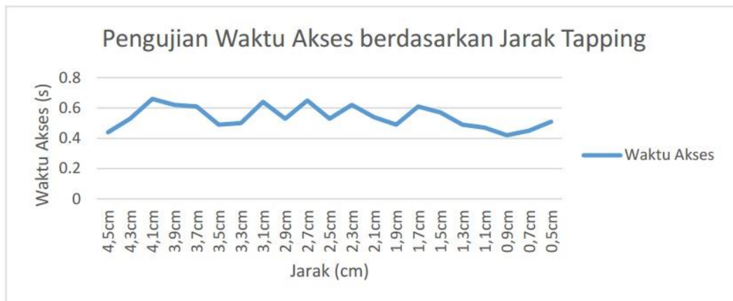
Gambar 3(a) Grafik Waktu Akses berdasarkan Jarak Tapping

Dari grafik di atas dapat diambil kesimpulan bahwa jauh/dekatnya jarak tapping tidak berpengaruh signifikan terhadap waktu akses. Hal ini disebabkan oleh koneksi ke web server yang membutuhkan waktu. Untuk pengujian ini, didapatkan waktu rata-rata akses yaitu sebesar 0.54s.