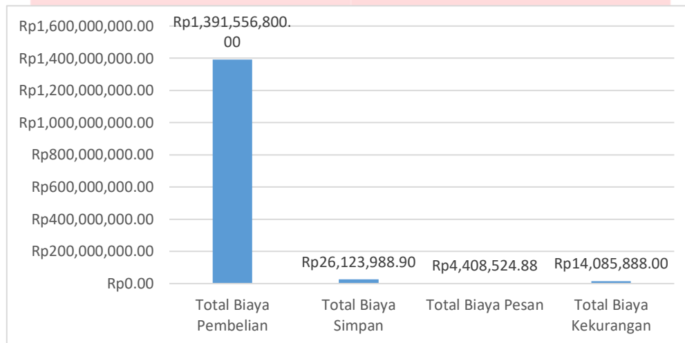
Gambar 1. 2 Kondisi Biaya Persediaan pada Mesin Laser Cutting CNC

Dapat dilihat pada Tabel 1.2, terdapat suku cadang yang mengalami stock out (tidak tersedianya barang pengganti di gudang) dan adanya gap antara jumlah pemakaian dengan jumlah pembelian selama periode 2019. Hal ini terjadi karena sistem penentuan kebutuhan inventaris suku cadang didasarkan pada permintaan operator di lapangan. Berikut merupakan kondisi biaya persediaan pada mesin laser cutting CNC.