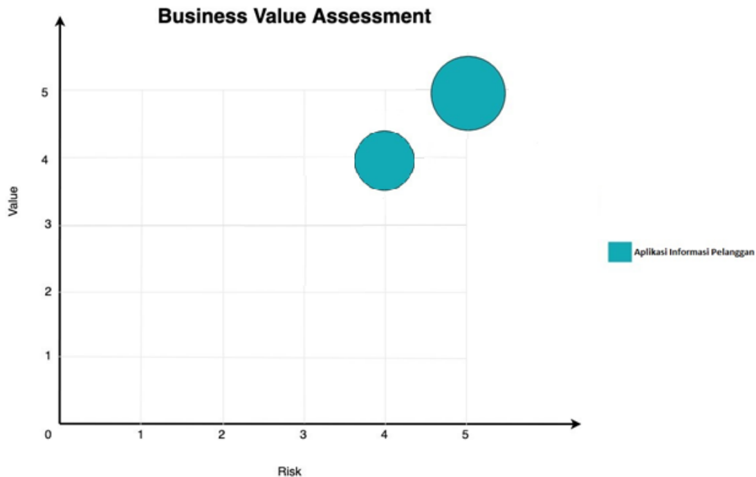
Gambar Business Value Assessment

Business value assessment merupakan salah satu cara untuk mengukur nilai sebuah proyek terhadap strategi bisnis perusahaan.