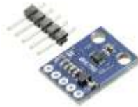
Gambar 2.4. 2 Sensor BH-1750

Sensor GY-302-BH1750 adalah sebuah modul sensor cahaya yang berbasis BH1750FVI yang dapat membaca intensitas cahaya dari 1 lux hingga 65535 lux.