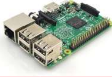
Gambar 2.4. 1 Raspberry Pi 3+ Model B

Foundation , Inggris. Perangkat ini beroperasi dengan cara yang sama seperti komputer pada umumnya, membutuhkan keyboard dan mouse untuk memasukan perintah, monitor dan catu daya. Raspberry Pi memiliki fitur GPIO ( General Purpose Input Output ) yang berfungsi sebagai port-port yang akan mengirimkan perintah yang sesuai dengan instruksi atau program yang udah dibuat [12]. Pada Raspberry Pi bahasa pemrograman yang digunakan adalah Python. Python sendiri dapat berkerja seperti Windows, Linux dan lain sebagainya [13].