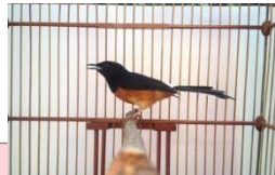
Gambar 4. Burung Murai Batu

Burung murai batu ( Copsychus malabaricus ) dikenal memiliki kemampuan berkicau yang baik dengan suara merdu yang sangat bervariasi. Burung murai batu memiliki ciri bulu berwarna hitam pada bagian punggung dan merah kecoklatan pada bagian dada serta memiliki ciri ekor yang panjang.