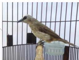
Gambar 5. Burung Trucukan

Burung trucukan ( Pycnonotus goiavier ) merupakan salah satu jenis burung berkicau yang banyak digemari dan dipelihara karena suaranya yang mengalun dengan ropelannya yang khas. Burung trucukan memiliki ukuran kurang lebih 20cm dengan badan berwarna putih dan coklat pucat. Burung jenis ini sering dijumpai sehari-hari baik di taman dan juga pepohonan rimbun di pinggir jalan.