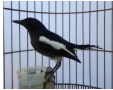
Gambar 3. Burung Kacer