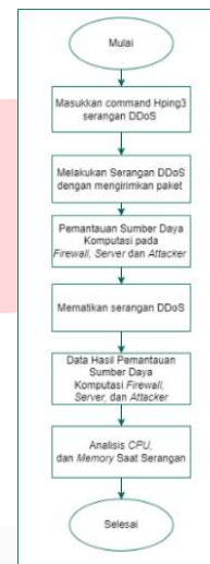
GAMBAR 6 PENGUJIAN SAAT SERANGAN SERVICE HTTP BLOCK