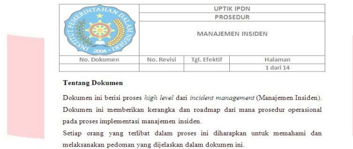
Gambar 2 Screenshot SOP

Pada Gambar 2 menunjukkan contoh screenshot dokumen SOP yang telah dibuat.