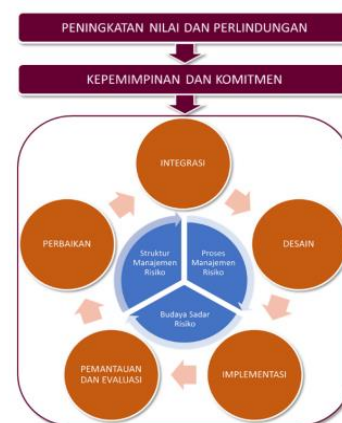
Gambar II. 1

Kerangka manajemen risiko SPBE menguraikan unsur-unsur mendasar yang dijadikan landasan dalam penerapan manajemen risiko SPBE pada instansi pemerintah pusat dan daerah. Tujuan kerangka manajemen risiko SPBE adalah untuk membantu otoritas pusat dan daerah dalam mengintegrasikan manajemen risiko SPBE ke dalam kegiatan yang bertujuan untuk melaksanakan tugas dan fungsi otoritas pusat dan daerah. Agar manajemen risiko SPBE dapat terlaksana dengan baik, instansi pusat dan pemerintah daerah dapat langsung mengadopsi atau memodifikasi kerangka manajemen risiko SPBE sesuai dengan konteks internal dan eksternal lingkungan masing-masing. Elemen mendasar dari kerangka ini mencakup prinsip-prinsip yang terkait dengan peningkatan dan perlindungan nilai, kepemimpinan dan komitmen, integrasi, perbaikan, desain, implementasi, pemantauan dan evaluasi, serta budaya sadar risiko.