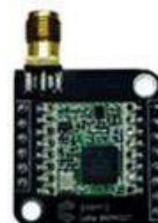
GAMBAR 1. LoRa RF95W

LoRa (Long Range) adalah teknologi frekuensi audio nirkabel yang beroperasi dalam spektrum frekuensi radio bebas lisensi[2], yang diperkenalkan oleh Semtech pada tahun 2013. Karakteristik lain dari LoRa adalah daya pancar yang dapat mencakup area yang cukup luas, konsumsi daya yang rendah, dan transmisi data yang aman, terutama di lingkungan perkotaan yang kompleks. Berbagai fitur LoRa membuatnya ideal untuk pekerjaan