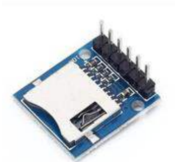
GAMBAR 2. Micro SDCard Module

Micro SDCard Module atau bisa disebut data logger merupakan suatu alat elektronik yang mencatat hasil data sensor dan instrumen. Salah satu keuntungan menggunakan data logger adalah kemampuan otomatis mengumpulkan data setiap 24 jam atau saat alat sedang aktif. Setelah diaktifkan, data logger digunakan dan ditinggalkan untuk mengukur dan merekam informasi selama periode pemantauan [3]. Data logger sudah sangat umum digunakan dalam bidang yang berhubungan dengan penyimpanan data dari sensor. Selain itu data logger juga bisa digunakan untuk mengetahui apakah sensor yang digunakan berfungsi dengan baik.