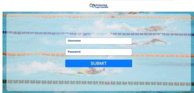
GAMBAR 4. 1 Login Session

Pada bagian ini, akan disajikan hasil implementasi sistem swimming lap counter berbasis website yang telah dikembangkan. Analisis data yang diperoleh dari pengujian yang telah dilakukan akan dibahas, termasuk kinerja sistem dalam menghitung waktu putaran renang, efisiensi penerimaan data dan tampilan yang sesuai dengan kebutuhan. Pengujian dilakukan dalam kondisi mensimulasikan situasi pertandingan sesungguhnya.