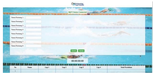
GAMBAR 4. 2 Dashboard

Gambar 4. 1 merupakan tampilan awal ketika website dibuka untuk pertama kalinya, yaitu halaman Login Session . Halaman login ini dirancang khusus untuk digunakan oleh juri dalam pertandingan yang diintegrasikan dengan sistem swimming lap counter . Untuk memastikan tingkat keamanan yang tinggi, akses ke halaman ini dibatasi hanya untuk juri. Username dan password yang diperlukan untuk login telah ditentukan dan disesuaikan khusus hanya untuk para juri. Hal ini memastikan bahwa hanya individu yang berwenang, dalam hal ini juri, yang dapat mengakses fitur-fitur yang sensitif dan penting yang ada didalam website dari pertandingan. Dengan demikian, integritas data dan keandalan sistem tetap terjaga, serta meminimalkan risiko akses tidak sah yang dapat mengganggu jalannya pertandingan renang.