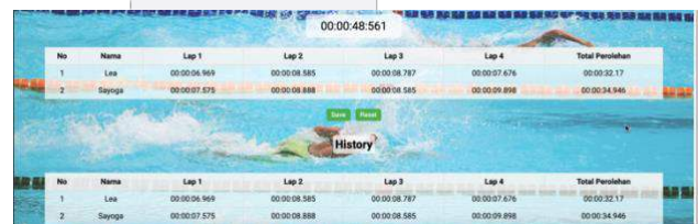
GAMBAR 4. 3 Pengujian Website

Gambar 4. 3 merupakan dashboard utama website swimming lap counter . Pada bagian atas halaman dashboard terdapat indicator status koneksi MQTT yang menunjukkan apakah sistem terhubung dengan baik dengan nilai Connected (jika telah terkoneksi) dan Not Connected (jika belum terkoneksi). Selanjutnya terdapat kolom input nama perenang yang dimana setiap kolom input diberi label "Nama Perenang" diikuti dengan nomor, sesuai dengan jumlah perenang yang akan melakukan pertandingan untuk memudahkan identifikasi. Kemudian terdapat tombol submit yang hanya dapat ditekan oleh juri ketika pertandingan akan dimulai, start pertandingan akan ditandai dengan bunyi yang dihasilkan oleh buzzer yang sudah diintegrasikan ketika juri menekan tombol submit seluruh sistem akan berjalan. Termasuk pada kolom Counting Timer , yang menampilkan stopwatch yang digunakan selama pertandingan berlangsung, menunjukkan waktu dalam format jam, menit, detik dan milidetik.