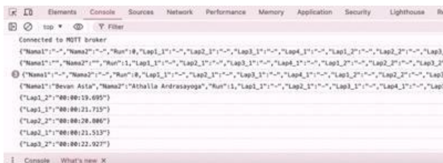
GAMBAR 4. 4 Data yang diterima

Untuk memastikan data yang diolah oleh sistem yang akan dikirimkan ke website untuk ditampilkan dapat dilihat pada tab Inspect yang dapat diakses pada website . Pada tab inspect lalu menu Console digunakan untuk menampilkan log, pesan error dan hasil eksekusi kode. Gambar 4. 4 merupakan menu console dari website swimming lap counter yang menunjukkan indikator konektivitas dengan MQTT Broker yang mengindikasikan bahwa data yang ditampilkan merupakan data sebuah file HTML dalam format JSON ( JavaScript Object Notation ). Format ini digunakan untuk menyimpan dan menukar data secara terstruktur. Menu Console menyajikan data yang diterima seperti; label “Lap1_1”, “Lap2_1” dan seterusnya dengan rincian (“Nomor Lap_Nama Perenang”). Pada menu tersebut juga menyertakan timestamp , yang menunjukkan waktu ketika data tersebut direkam.