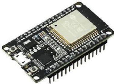
GAMBAR 2.2 ESP32

ESP32 Series adalah sebuah chip combo Wi-Fi 2,4GHz dan bluetooth yang dirancang dengan teknologi 40nm low power . ESP32 menawarkan berbagai fitur dan spesifikasi yang menjadikannya pilihan yang populer untuk berbagai macam aplikasi IoT ( Internet of Things ). Spesifikasi dasar ESP32 sebagai berikut