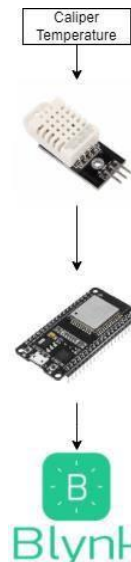
GAMBAR 3.2 Perancangan sensor DHT22

Pada caliper temperature menggunakan sensor DHT22 untuk mengukur suhu pada kaliper rem mobil. Pengujian dilakukan dengan menempatkan sensor di belakang kaliper rem mobil [4], suhu yang terbaca oleh sensor selanjutnya di kirimkan ke Blynk cloud melalui mikrokontroler