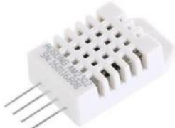
GAMBAR 2.1 DHT22

Sensor DHT22 untuk mengukur suhu pada kaliper rem mobil. Pengujian dilakukan dengan menempatkan sensor di belakang kaliper rem mobil, suhu yang terbaca oleh sensor selanjutnya di kirimkan ke Blynk cloud melalui mikrokontroler. Dalam pengembangan alat ini, sensor DHT22 digunakan untuk mengetahui suhu pada kaliper rem mobil melalui perubahan resistansi, selanjutnya DHT22 menggunakan protokol komunikasi 1-wire untuk mengirimkan data ke mikrokontroler ESP32