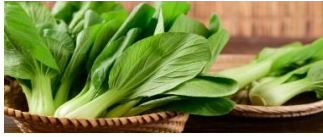
GAMBAR 2. 2 Pakcoy

Pakcoy ( Brassica rapa L. ) termasuk ke dalam golongan tanaman sawi yang mudah di dapat dengan harga yang ekonomis. Tanaman pakcoy memiliki banyak kandungan yang dibutuhkan tubuh dan bermanfaat bagi kesehatan karena mengandung banyak vitamin C, aldehida, keton, flavonoid, selenium, karotenoid, dan glukosinolat. Kebutuhan pacoy terus meningkat seiring dengan tingginya permintaan akan sayuran pakcoy.