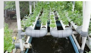
GAMBAR 2.1 Akuaponik

Akuaponik adalah metode budidaya yang memadukan budidaya hidroponik dengan akuakultur yang berupa simbiosis mutualisme. Akuakultur merupakan budidaya ikan, dan hidroponik adalah budidaya tanaman yang berarti budidaya tanaman yang