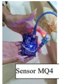
GAMBAR 3.7 Rangkaian Sensor MQ4

Pastikan semua kabel terhubung dengan baik dan kuat untuk mencegah koneksi longgar. Verifikasi bahwa pin VCC dan GND dari sensor MQ4 terhubung dengan benar (kutub '+' dan '-'). Selain itu, pastikan GND dari Wemos D1 R32 terhubung ke GND pada sensor MQ4 untuk referensi ground yang konsisten.