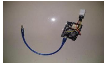
GAMBAR 3.5 Rangkaian Sensor BMP180

I2C, sementara GPIO22 (SCL) menyinkronkan data dengan clock dari sensor BMP180. Pin 3V3 menyediakan daya untuk sensor, dan pin GND memastikan referensi ground yang konsisten untuk seluruh sistem.