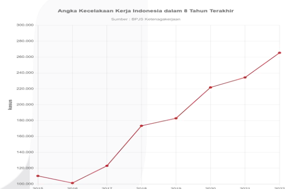
GAMBAR 1. Jumlah Kecelakaan Kerja Indonesia Tahun 2015-2022

kerja terus meningkat setiap tahunnya. Berikut merupakan data grafiknya: