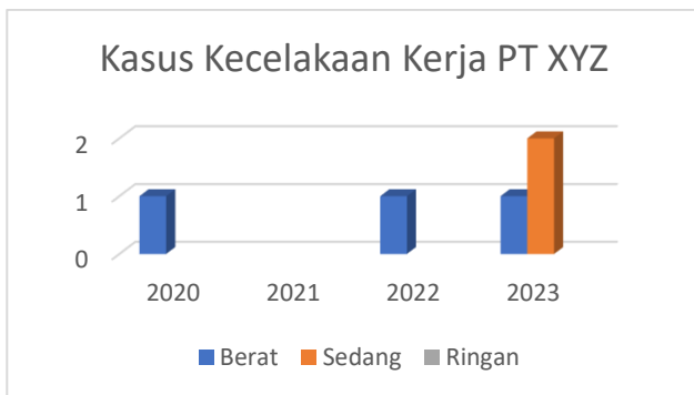
GAMBAR 2. Data Kecelakaan Kerja PT XYZ

manajemen K3 yang komprehensif, yang artinya Sistem Manajemen K3 di perusahaan belum mencakup semua aspek yang diperlukan untuk memastikan keselamatan dan kesehatan di tempat kerja. Berdasarkan hasil wawancara juga, diketahui bahwa PT XYZ telah mengalami berbagai insiden kecelakaan kerja yang disebabkan oleh beragam faktor. Beberapa insiden ini bahkan mengakibatkan kategori kasus sedang hingga kematian pada pekerjaannya. Kecelakaan yang terjadi menunjukkan bahwa sistem manajemen K3 yang ada belum sepenuhnya efektif dalam mencegah terjadinya insiden-insiden tersebut. Berikut adalah data kecelakaan kerja di PT XYZ dari tahun 2020 hingga 2023.