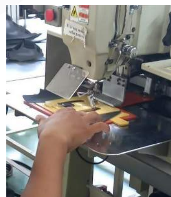
GAMBAR 3 Proses Pemasangan Mold