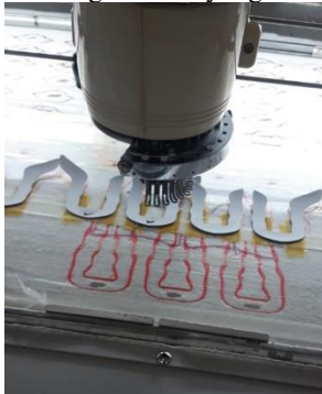
GAMBAR 4 Penempelan Bahan Dengan Pola

Pada penempelan bahan pada pola disini operator diajarkan bagaimana cara saat penempelan yang sesuai dengan standar yaitu berjarak 2 cm dari jalan tepi pinggir bahan material. Berikut ini merupakan penempelan bahan dengan mold yang telah sesuai.