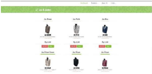
GAMBAR 4 HALAMAN PRODUCT

Gambar di atas merupakan tampilan high fidelity dari halaman home tampilan tersebut merupakan penyesuaian atau sama dengan desain yang ada pada low fidelity , tampilan high fidelity sudah diberikan aksan warna, gambar atau deskripsi yang sesuai untuk masing masing section