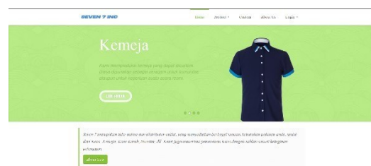
GAMBAR 3 BERANDA

High Fidelity (Hi-Fi) merujuk pada prototipe atau desain visual yang sangat mendetail dan realistis, hampir menyerupai produk akhir atau aplikasi yang sudah selesai. Biasanya digunakan dalam desain antarmuka pengguna (UI) atau pengalaman pengguna (UX) untuk menunjukkan bagaimana tampilan dan interaksi aplikasi atau situs web akan terlihat dan berfungsi.