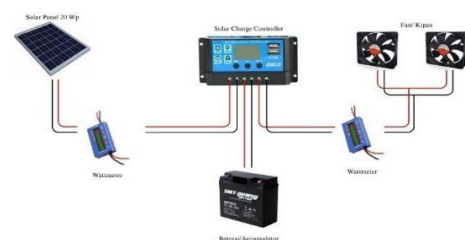
GAMBAR 1 (A)

Rancangan pada sistem PV dalam mesin pengering solar dryer menggunakan metode penelitian dan studi literatur, Penelitian yang di maksud yaitu melakukan proses pengambilan data pada sistem PV selama 10 hari dengan rentang waktu pengambilan dimulai pukul 10.00 hingga 16.00 WIB. Pada alat mesin pengering solar dryer terdapat dua bagian, yaitu material dan kelistrikan ( electrical ). Sistem PV termasuk ke dalam bagian electrical , dengan peran yang penting dalam mendukung proses pengeringan selama waktu operasional 12 Jam. Untuk mencukupi kebutuhan operasional alat mesin pengering tersebut perlu membuat perancangan sebuah sistem PV untuk memenuhi pasokan daya agar dapat berjalannya proses sistem pada alat pengering solar dryer . Dengan gambaran rancangan wiring sistem electrical dan fungsi setiap komponennya sebagai berikut: