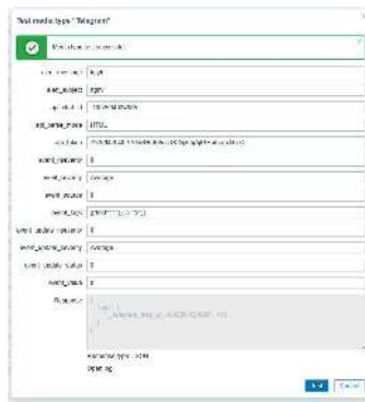
GAMBAR 9 Notification Testing