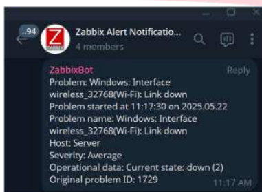
GAMBAR 10 Hasil Testing Notifikasi