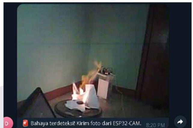
GAMBAR 2 (Notifikasi Sistem Kebakaran Ketika Mendeteksi Kebakaran)

Ketika sistem mendeteksi kondisi yang berbahaya, maka akan langsung mengirimkan notifikasi berupa foto ke Telegram dan membunyikan alarm sebagai peringatan lokal jika penghuni berada di sekitar kejadian.