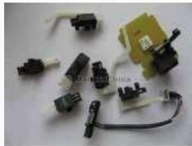
Gambar 2. Sensor

Sensor merupakan alat yang berfungsi sebagai pendeteksi perubahan energi fisika, energi kimia, energi biologi dan energi mekanik yang diubah menjadi suatu besaran elektrik.[4]