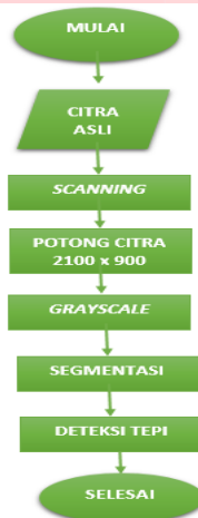
Gambar 3.2 Diagram Alir Proses Preprocessing

Tahap pertama yang dilakukan adalah pengambilan citra. Pengambilan citra dilakukan dengan scanning dari citra ronsen panoramic, lalu di seragamkan dengan di potong ke piksel 2100x900 dan mengubah ke dalam format JPG, lalu dikonversikan ke grayscale untuk menyederhanakan dan mempercepat waktu komputasi, lalu dilakukan proses segmentasi dengan mengambil bagian ciri citra yaitu gigi second dan third molar bagian kanan dan kiri.