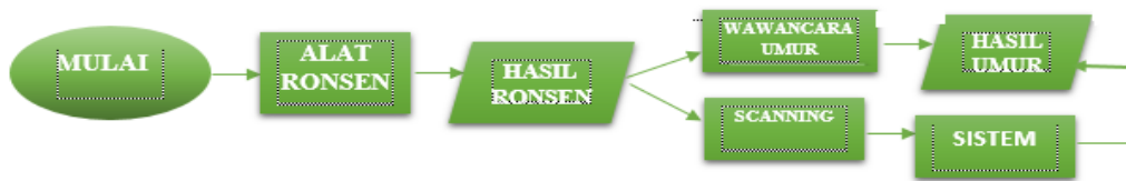
Gambar 3.1 Blok Diagram Sistem

Secara keseluruhan blok diagram tahapan dari proses perancangan sistem direpresentasikan sebagai berikut :