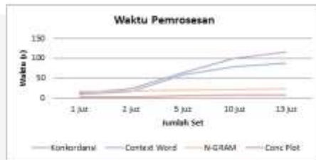
Gambar 3-2 : Grafik hasil analisis kecepatan pemrosesan