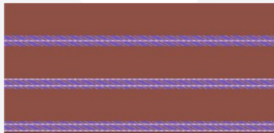
Gambar 3.3 ornamen atau variasi