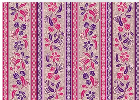
Gambar 2.1 contoh batik kalimantan

Batik adalah kain bergambar yang pembuatannya secara khusus dengan menuliskan atau menerakan malam pada kain, kemudian pengolahannya diproses dengan cara tertentu yang memiliki kekhasan. Batik Indonesia, sebagai keseluruhan teknik, teknologi, serta pengembangan motif dan budaya yang terkait. Perlu dicatat bahwa wilayah tersebut bukanlah area yang dipengaruhi oleh Hinduisme tetapi diketahui memiliki tradisi kuno membuat batik [3]. Batik termasuk kerajinan yang memiliki nilai seni tinggi dan telah menjadi bagian dari budaya Indonesia sejak lama salah satunya batik terdapat di daerah kalimantan seperti gambar 2.1 tersebut [3]