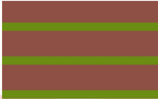
Gambar 3.2 gambar dua background