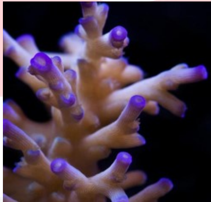
Gambar 2.2. karang acropora echinata

Acropora echinata adalah spesies karang Acroporidae yang pertama kali dijelaskan oleh Dana pada tahun 1846. Ditemukan di terumbu dangkal, tropis, terlindung di lingkungan laut, ditemukan di kedalaman 8 sampai 25 m (26 sampai 82 kaki) dengan air bersih. Spesies ini terdaftar sebagai rentan dalam Daftar Merah IUCN, dan memiliki populasi yang menurun. Ini tidak umum namun ditemukan di area yang luas, dan terdaftar di bawah CITES Appendix II. Koloni koloni Acropora echinata terbuat dari cabang datar dan menyerupai bottlebrush, dengan cabang-cabang rapi yang disusun rapi[2].