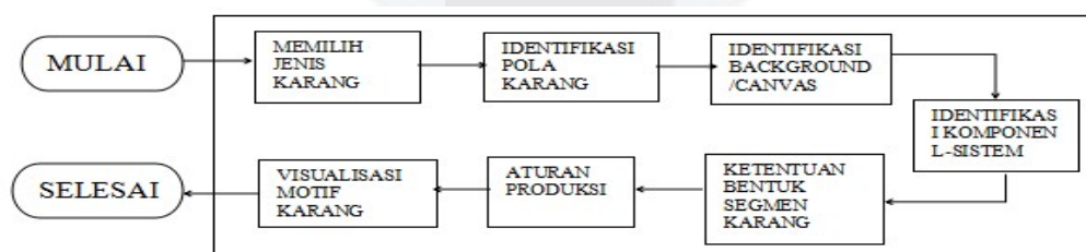
Gambar 3.1 Skema perancangan motif karang

Aplikasi Batik berbasis web ini dibuat untuk menghasilkan variasi motif batik jenis karang, khususnya motif batik yang berjenis karang Acropora echinata . Variasi motif batik yang dihasilkan dari aplikasi ini termasuk motif batik kontemporer. Kebutuhan untuk menjalankan sistem aplikasi batik yang akan dibuat sangat berkaitan dengan perangkat lunak yang digunakan. Dalam perancangan program ini, untuk melakukan pengembangan desain batik jenis karang Acropora echinata ini untuk membuat aplikasi menggunakan bahasa pemrograman PHP ( Hypertext Preprocessor ) dan aplikasi yang harus dijalankan menggunakan web .