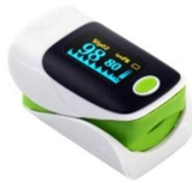
Gambar 2.2 Finger pulse oximeter

Alat yang dipakai pada penelitian ini untuk mengukur heart rate adalah finger pulse oximeter dengan cara dipasang di jari telunjuk.