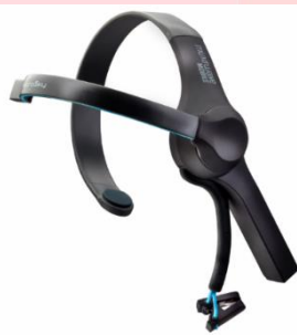
Gambar 2.1 Alat perekam sinyal otak [6]

Gambar 2.1, merupakan alat yang digunakan dalam jurnal ini. Alat ini merupakan alat EEG 1 channel dan dapat terkoneksi dengan laptop melalui bluetooth . Electroencephalograph atau EEG merupakan alat perekam aktivitas elektrik atau sinyal otak karena fluktuasi ion pada neuron otak [2]. Pada umumnya, EEG dipasang dengan cara menempelkan elektroda di kepala manusia.