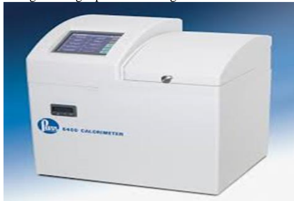
Gambar 2.1 Alat Kalori Meter

volume konstan tanpa aliran, atau dengan kata lain reaksi pembakaran dilakukan tanpa menggunakan nyala api melainkan menggunakan gas oksigen sebagai pembakar dengan volume konstan atau tekanan tinggi.