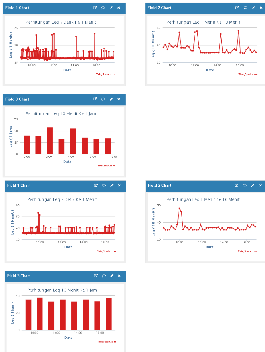
Gambar 4.1. Hasil Grafik pada thingspeak di hari pertama dan kedua

Hasil pada gambar 4.1 adalah grafik pengukuran dan perhitungan tingkat kebisingan selama aktivitas 8 jam pada hari pertama dan kedua