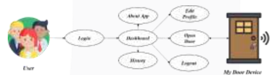
Gambar 2 Use Case Aplikasi My Door.

Pada Gambar 2 terlihat interaksi yang dapat dilakukan pengguna ( customer ) pada aplikasi. User dapat melakukan aktifitas bergantung dengan Firebase Authentication dan Firebase Database