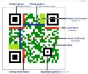
Gambar 2. 1 Struktur QR Code (Ariadi,2011).

QR code merupakan simbol bertipe matriks dengan sebuah struktur sel berbentuk kotak. Simbol ini terdiri dari pola-pola fungsi untuk membuat proses pembacaan mudah dan area data tempat data disimpan [1]. QR Code memiliki struktur seperti yang terlihat pada gambar 2.1 di bawah ini :