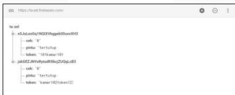
Gambar 5 Firebase Real Time Database

Pengujian ini dilakukan untuk memastikan data yang dikirim oleh user bisa tersimpan di Firestore Real Time Database . Hal tersebut bertujuan untuk mempermudah sistem dalam pengambilan dan penyimpanan data secara real time .