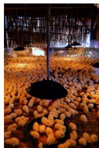
Gambar IV. 1 Produk Perusahaan

Produk yang dijual oleh peternakan XYZ adalah ayam ras jenis pejantan (Layer) yang langsung diambil dari peternakan. Masa panen dari Ayam Ras Pejantan (Layer) adalah 2 bulan dan memiliki bobot maksimal sebesar 8 – 9 ons per kornya.