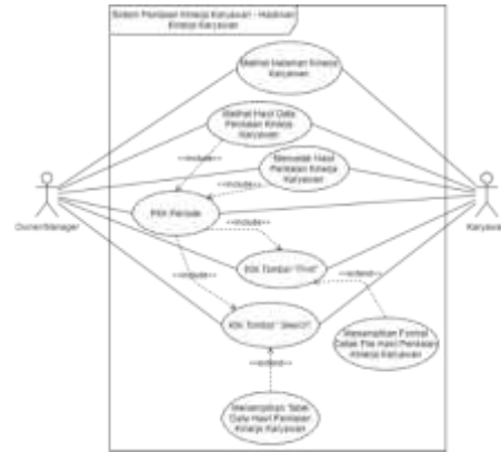
Gambar 3 Use Case Diagram - Halaman Kinerja Karyawan