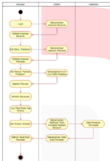
Gambar 4 Activity Diagram - Halaman Penilaian (Tambah Data)