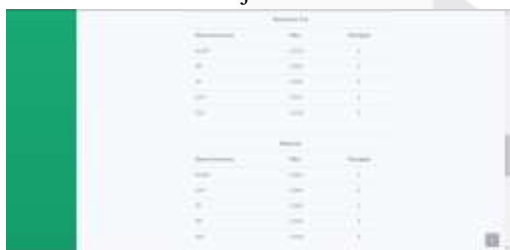
Gambar 13 Halaman Kinerja Karyawan - Lanjutan 3