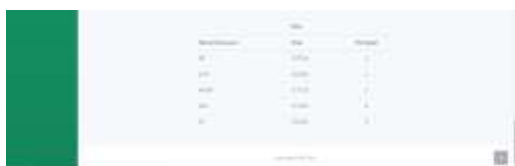
Gambar 13 Halaman Kinerja Karyawan - Lanjutan 5