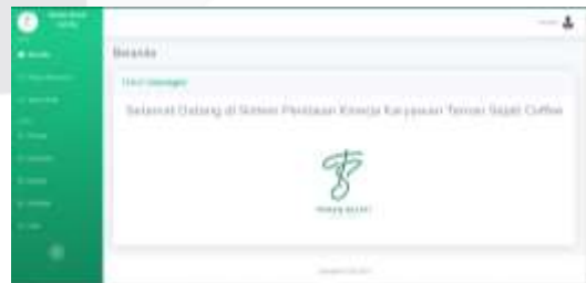
Gambar 7 Halaman Beranda