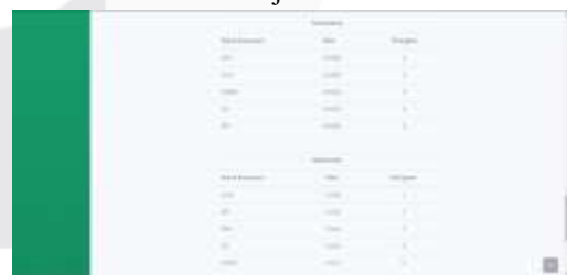
Gambar 13 Halaman Kinerja Karyawan - Lanjutan 4