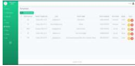
Gambar 9 Halaman Karyawan