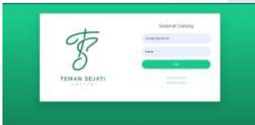
Gambar 6 Halaman Login

Pada tahap ini melakukan desain sistem diimplementasikan dalam bentuk aplikasi. Tahap ini menjelaskan mengenai hasil sistem yang dirancang. Adapun penjelasan mengenai desain antarmuka sistem yang dapat dilihat pada gambar-gambar berikut ini.