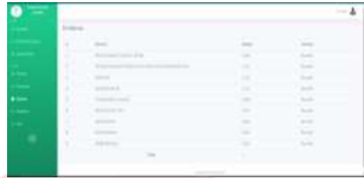
Gambar 11 Halaman Kriteria