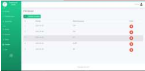
Gambar 12 Halaman Penilaian