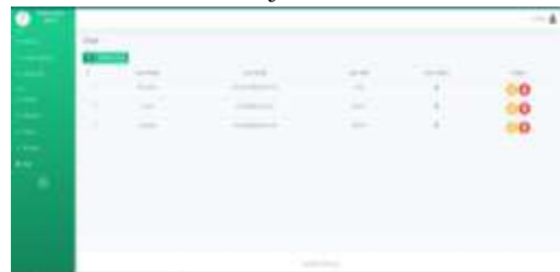
Gambar 14 Halaman User