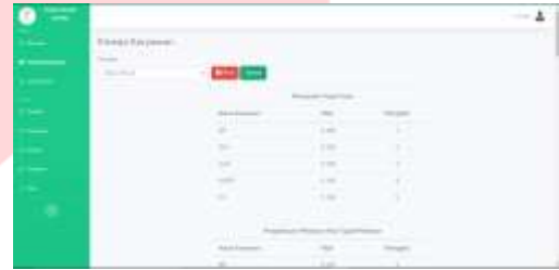
Gambar 13 Halaman Kinerja Karyawan