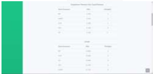
Gambar 13 Halaman Kinerja Karyawan - Lanjutan 1