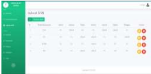
Gambar 10 Halaman Jadwal Shift