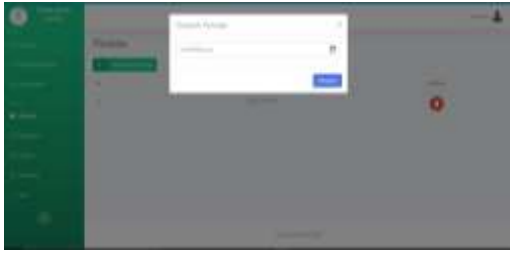
Gambar 8 Halaman Periode