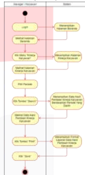
Gambar 5 Activity Diagram - Halaman Kinerja Karyawan