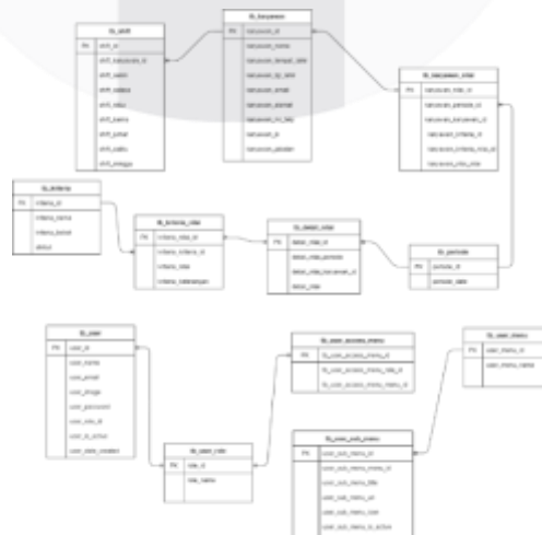
Gambar 1 Entity Relationship Diagram

Pada tahap ini akan menjelaskan mengenai rancangan sistem ke dalam bentuk diagram. Entity Relationship Diagram merupakan suatu model teknik pendekatan yang menyatakan atau menggambarkan hubungan suatu model. Didalam hubungan ini, dinyatakan yang utama dari ERD adalah menunjukkan objek data ( Entity ) dan hubungan ( Relationship ), yang ada pada Entity berikutnya [8]. Use Case Diagram merupakan suatu pemodelan untuk kelakuan ( behavior ) sistem yang akan dibuat [9]. Activity Diagram (Diagram Aktivitas) merupakan diagram yang menggambarkan workflow (aliran kerja) atau aktivitas dari sebuah sistem atau proses bisnis [10].