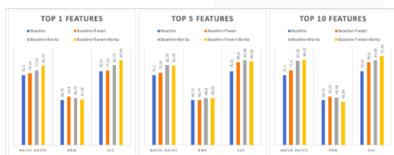
Gambar 10. Persebaran Data

Selanjutnya, pada model Top 10 features terjadi penurunan akurasi kembali untuk metode RNN dari nilai model awal 46,75% turun menjadi 44,99% pada korpus Tweet+Berita dengan nilai F1-Score 42,84%, untuk metode Naive Bayes dan SVM selalu mengalami peningkatan yang signifikan.