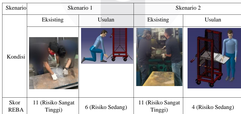
TABEL IV.5. 1 Perbandingan Postur Skenario 1 dan 2 pada Kondisi Eksisting dan Usulan