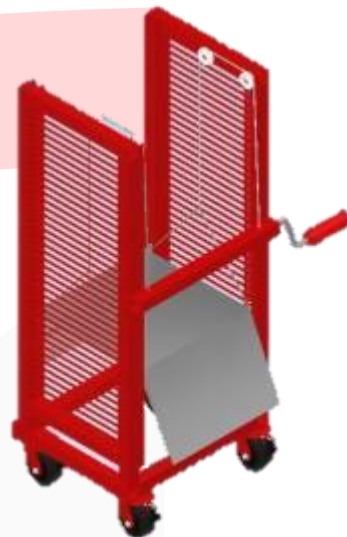
GAMBAR IV.5. 1 Rancangan Akhir MHE Usulan

diangkat secara manual dengan tenaga yang harus dikeluarkan operator adalah sebesar 392 N (beban material 40 kg). Setelah menggunakan MHE usulan dengan adanya bantuan wing tenaga yang harus dikeluarkan operator berkurang menjadi 257.6 N (setara mengangkat beban 26.3 kg). Sementara untuk proses 2 dimana operator harus mengangkat material sebab MHE eksisting tidak dapat mencapai ketinggian yang sama dengan meja facing , operator yang sebelumnya harus mengeluarkan tenaga sebesar 392 N, dengan adanya bantuan vertical lifting tenaga yang harus dikeluarkan operator menjadi hanya 81 N (setara dengan mengangkat beban 8.26 kg).