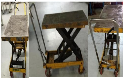
GAMBAR 1. 1 MHE Eksisting (Meja Hidrolik)

Divisi Tooling merupakan divisi pendukung dalam rantai produksi PT. XYZ Indonesia, yang pekerjaannya utamanya adalah membuat mold untuk digunakan oleh divisi Press. Selama pembuatannya mold dibagi menjadi dua bagian yang kemudian digabungkan dengan cara di-assembly . Dalam prosesnya mold melalui beberapa area yang berbeda di lantai kerja divisi Tooling dan melalui beberapa proses. Secara gambaran besar, area yang terlibat diantaranya area CNC, area casting , area facing , dan area assembly . Proses transportasi antar proses dan area tersebut dibantu dengan adanya alat bantu angkut atau material handling equipment (MHE) berupa meja hidrolik. Sistem hidrolik yang ada dioperasikan melalui tuas yang ada di bagian bawah meja dengan cara diinjak sehingga memungkinkan bagian meja untuk disesuaikan tingginya. Pada MHE tersebut juga terdapat roda dan pegangan untuk mempermudah mobilitas MHE.