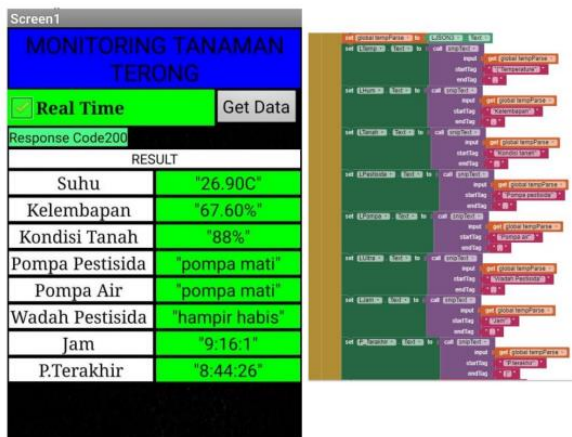
GAMBAR 2 ANDROID

MIT App Inventor ini berfungsi untuk membuat GUI pada aplikasi smartphone berbasis android. Data-data yang tersimpan dalam database akan ditampilkan pada aplikasi yang dibuat yang dimana meliputi data suhu, kelembaban, kondisi tanah, pompa pestisida, pompa air, wadah pestisida, jam dan penyiraman terakhir. Aplikasi yang dibuat menggunakan software Mit App Inventor, Berikut adalah tampilan data pada aplikasi: