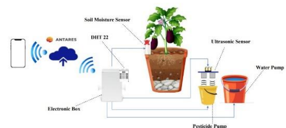
GAMBAR 1 DESAIN SISTEM

Desain sistem diatas akan menjelaskan secara singkat perancangan sistem yang mampu memonitor dan mengendalikan penyiraman air dan penyiraman pestisida secara otomatis pada tanaman terong. Sistem ini dirancang dengan menempatkan box elektronik yang berisikan mikrokontroler, LCD, relay dan project board disebelah tanaman. Sedangkan dibagian luar box terdapat sensor kelembaban tanah, sensor ultrasonik, sensor suhu dan 2 pompa yang masing -masing terhubung dengan dengan sumber air dan sumber pestisida. Sistem pengendalian hama dan monitoring ini terhubung dengan internet menggunakan modul Wi-Fi yang terdapat pada mikrokontroler dan mengirim data dari sensor secara real-time ke platfrom Antares yang berfungsi sebagai database. Selanjutnya aplikasi android yang telah dibuat akan dihubungkan dengan database untuk menampilkan data secara real-time di smartphone.