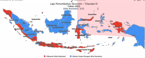
GAMBAR 1 LAJU PERTUMBUHAN EKONOMI NASIONAL TRIWULAN III TAHUN 2021

Meski Provinsi Jawa Barat tidak masuk pengembangan Kawasan Industri (KI) prioritas dalam RPJMN 2020-2024. Menurut PDRB 2019, Jawa Barat menopang ekonomi Indonesia sebesar 13,42%. Jawa Barat juga menopang 17 % kontributor tertinggi realisasi investasi, 20,8% kontributor tertinggi terhadap realisasi investasi penanaman modal asing nasional, 28,3 % kontributor tertinggi terhadap PDB nasional sektor industri manufaktur dan 17,85% kontributor tertinggi ekspor nasional. Sementara itu, berdasarkan Badan Pusat Statistik (BPS) di tahun 2021 laju pertumbuhan ekonomi pada Triwulan II Tahun 2021, Jawa Barat berada di bawah nilai Nasional sebesar 3,45 dibandingkan dengan nilai nasional yakni 3,51.