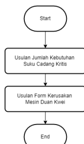
GAMBAR 4 (Perancangan Usulan Perbaikan)

Langkah-langkah perancangan usulan perbaikan dibagi menjadi beberapa langkah yang dapat dilihat pada gambar 4.