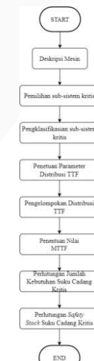
GAMBAR 3 (Flowchart Pengolahan data)

Pada gambar 3 merupakan tahap pengolahan data, dalam tahapan pengolahan data akan dilakukan beberapa langkah-langkah yang dilakukan dan menghasilkan output sesuai dengan tujuan dari penelitian ini: