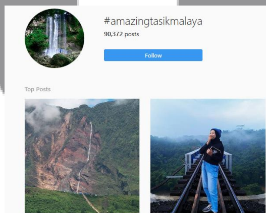
Gambar 4.1 Jumlah unggahan-unggahan yang menggunakan hashtag #amazingtasikmalaya

Andhika Pratama selaku praktisi menjelaskan dengan adanya kegiatan buzz yang telah di lakukan @amazingtasikmalaya sangat membantu pembentukan e-WoM karena secara tidak langsung para pengikut yang mengikuti kegiatan give away akan merekomendasikan akunya kepada temanya, lalu dengan adanya kegiatan photo challenge akan memperluas publisitas dari akun @amazingtasikmalaya karena adanya hashtag #amazingtasikmalaya. Dengan adanya hashtag tersebut akun @amazingtasikmalaya sangat diapresiasi jika dilihat jumlah unggahan dari hashtag itu sendiri sudah mencapai 90372 unggahan.