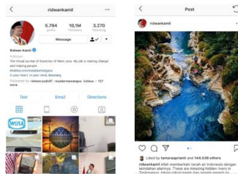
Gambar 4.2 Repost @amazingtasikmalaya di akun @ridwankamil