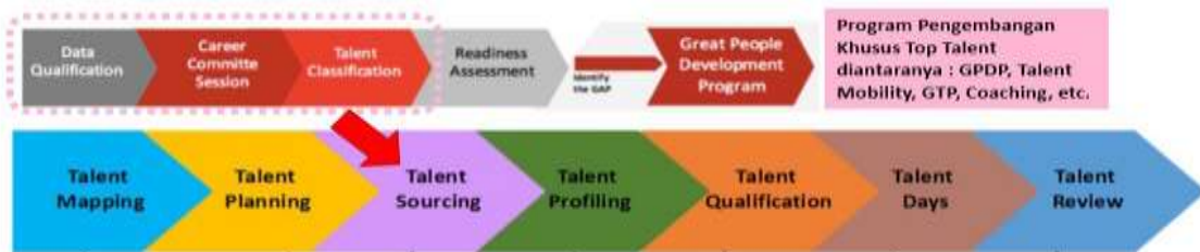
Gambar 1.1 Program Manajemen Talenta Yayasan Pendidikan Telkom

Sekelompok orang berbakat tersebut disebut dengan talent pool . [12] menjelaskan bahwa adanya talent pool diciptakan sebagai sebuah tempat dalam melakukan pengembangan sumber daya manusia di dalam perusahaan untuk mempertahankan bakat terbaik. Adanya talent pool dalam sebuah perusahaan membantu untuk mengidentifikasi kapasitas yang dimiliki oleh karyawan untuk dapat terus dikembangkan dan kemudian memiliki potensi secara umum untuk memimpin sebuah perusahaan.