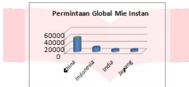
Gambar 1.2 Permintaan Global Mie Instan

Persaingan dalam dunia bisnis terjadi hampir di seluruh jenis industri. Pada dunia bisnis industri, tren konsumsi masyarakat Indonesia saat ini sudah mulai bergeser ke jenis makanan instan. Pergeseran pola konsumsi masyarakat ini ternyata berdampak positif terhadap industri makanan instan, terutama pada industri mie instan. Tidak dapat dipungkiri mie memang sudah menjadi bagian penting dalam pola makan rumah tangga, mahasiswa tidak hanya di perkotaan tetapi juga di pedesaan. Peran mie memang sebagai pangan pokok, namun dapat berperan penting sehingga sering dijumpai masyarakat. Peluang bisnis ini sangat menjanjikan keuntungan bagi produsen. Persaingan mie instan yang menjadi persaingan gaya hidup masyarakat dan terdapat tiga factor penyebabnya yaitu factor harga yang dibanderol sangat terjangkau, Praktis dan mudah ditemui dimana – mana, citra rasa dari mie instan tersebut ( sumber: kompasiana.com ). Permintaan pasar mie instan di Indonesia sepanjang 2019 merupakan yang tertinggi kedua di dunia setelah China, menurut data World Instant Noodles Association (WINA). Berikut ini permintaan global mie instan yang ada pada gambar 1.2 :